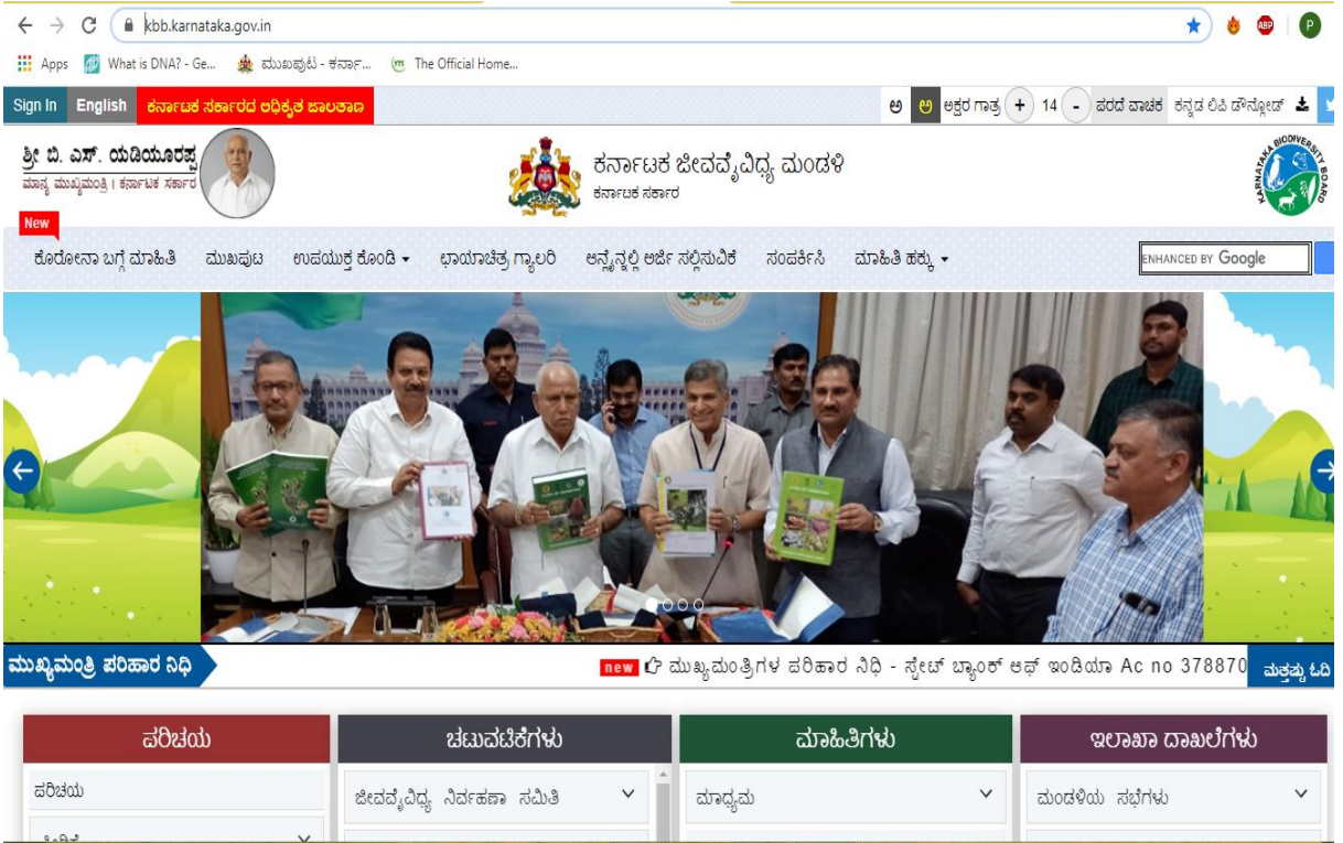
ಮಂಡಳಿಯ ನವೀಕೃತ ಜಾಲತಾಣ