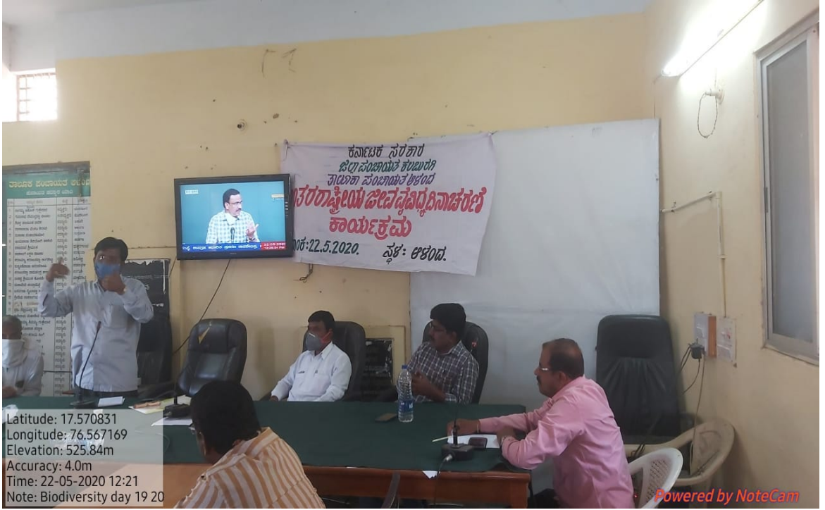
ಆಳಂದ ತಾಲ್ಲೂಕು, ಕಲಬುರಗಿ