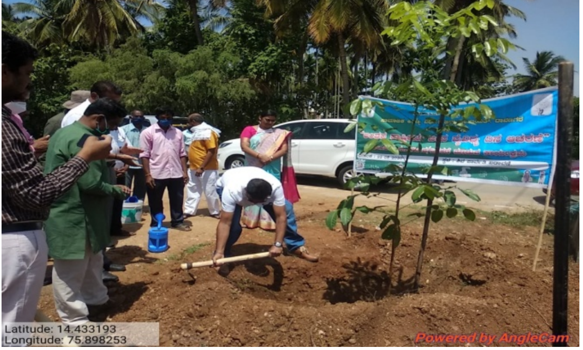
ಜಿಲ್ಲಾ ಪಂಚಾಯತಿ, ದಾವಣಗೆರೆ