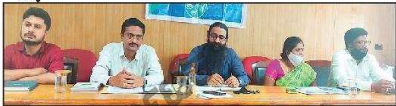
ಕೋಲಾರ ತಾಪಂ ಸಭಾಂಗಣದಲ್ಲಿ ಮುಖ್ಯವಾರ ತಾಲೂಕು ಮಟ್ಟದ ಜನತಾ ಜೀವ ಜಾಗೃತಿ ಅಭಿಯಾನ ಕಾರ್ಯಾಗಾರ ನಡೆಯಿತು.