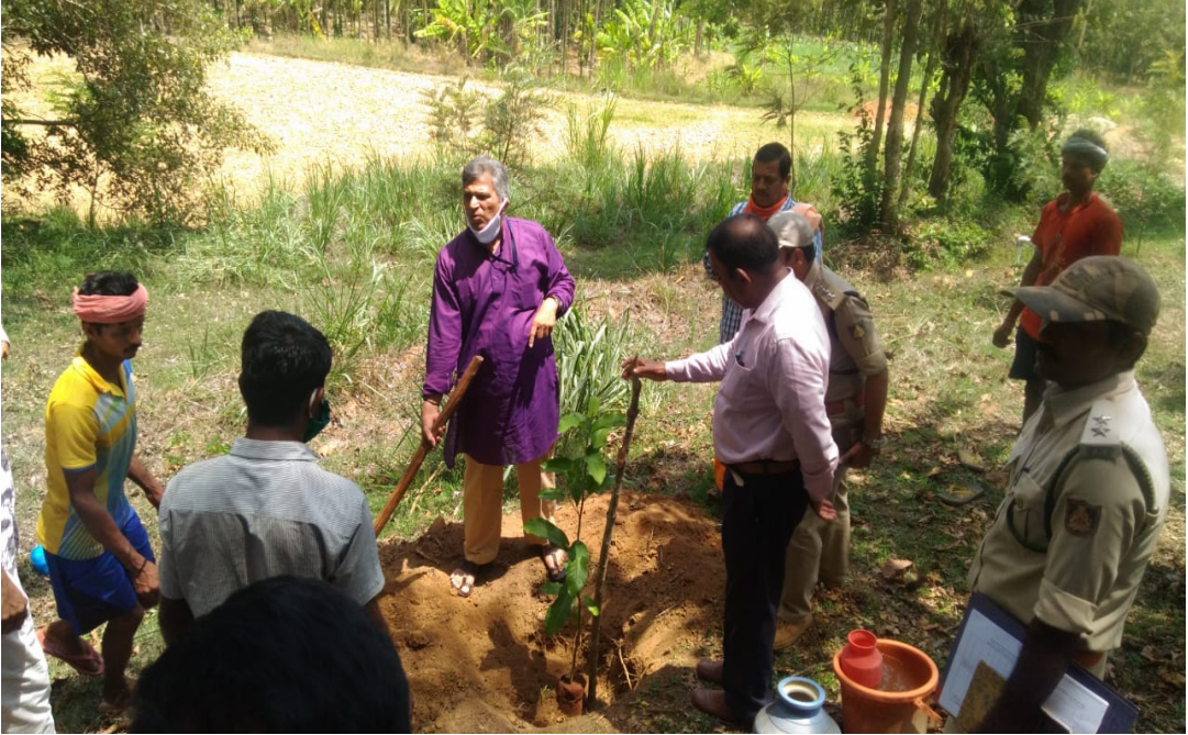
ದಿನಾಂಕ 24.05.2020ರಂದು ಶಿವಮೊಗ್ಗ ಜಿಲ್ಲೆಯ ಸಾಗರ ತಾಲ್ಲೂಕಿನ ಕೈತೋಟ ಗ್ರಾಮದ ಕಾಡಿನಕೆರೆ ಪುನಶ್ಚೇತನ ಅಭಿಯಾನ