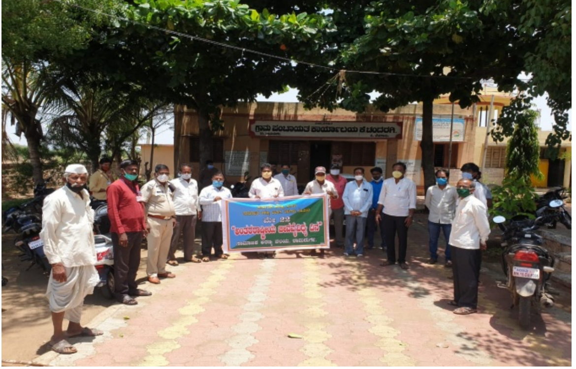
ಚಂದರಗಿ ಗ್ರಾಮ ಪಂಚಾಯತಿ, ರಾಮದುರ್ಗ ತಾಲ್ಲೂಕು, ಬೆಳಗಾವಿ