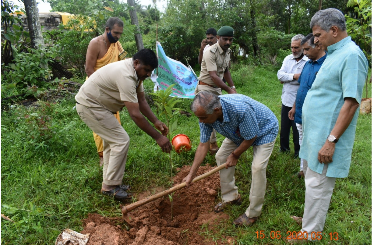
ದಿನಾಂಕ 15.06.2020ರಂದು ರಾಮಚಂದ್ರಾಪುರ ಮಠದ ವ್ಯಾಪ್ತಿಯಲ್ಲಿ ಕೈಗೊಂಡ ಅಭಿಯಾನದಲ್ಲಿ ವೃಕ್ಷಾರೋಪಣೆ