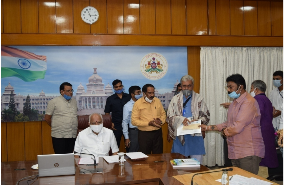
ಮಾನ್ಯ ಅರಣ್ಯ ಸಚಿವರಿಂದ ಚೆಕ್ ವಿತರಣೆ