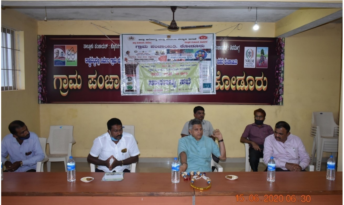
ದಿನಾಂಕ 15.06.2020ರಂದು ಹೊಸನಗರ ತಾಲ್ಲೂಕಿನ ಕೋಡೂರು ಗ್ರಾಮ ಪಂಚಾಯತಿ ಅಭಿಯಾನದಲ್ಲಿ ಅಮ್ಮನಘಟ್ಟ ಸೂಕ್ಷ್ಮ ಪ್ರದೇಶವನ್ನು ಪಾರಂಪರಿಕ ತಾಣವಾಗಿ ಸಂರಕ್ಷಿಸಲು ನಿರ್ಣಯ.