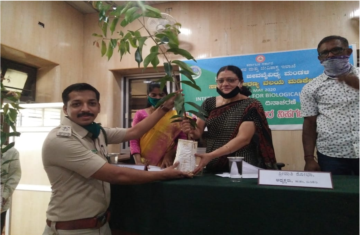
ಜಿಲ್ಲಾ ಪಂಚಾಯತಿ ಸಭಾಂಗಣ, ಮಡಿಕೇರಿ