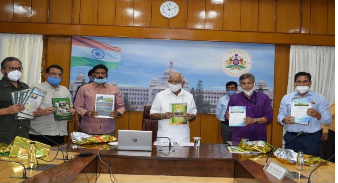
ಸನ್ಮಾನ್ಯ ಮುಖ್ಯಮಂತ್ರಿಗಳು ಹಾಗೂ ಗಣ್ಯರಿಂದ ಸಂಶೋಧನಾ ವರದಿಗಳು ಮತ್ತು ಕರಪತ್ರಗಳ ಬಿಡುಗಡೆ