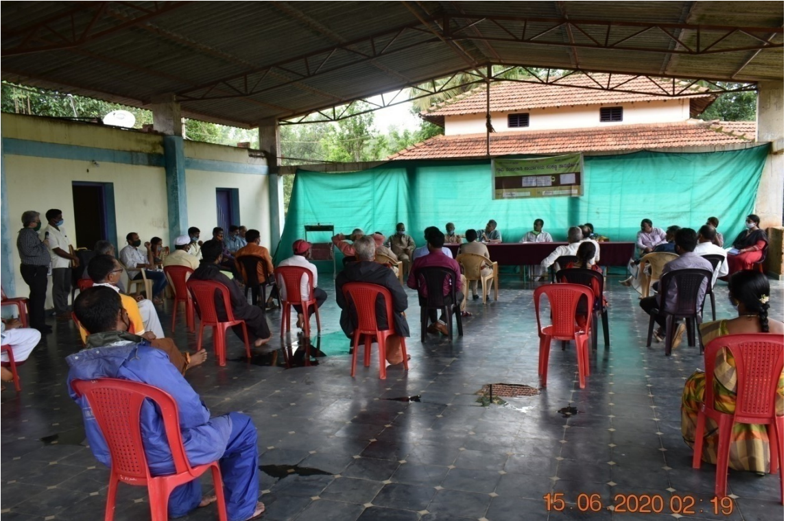
ದಿನಾಂಕ 15.06.2020ರಂದು ಅಂಬಾರಗುಡ್ಡ ಜೀವವೈವಿಧ್ಯ ಪಾರಂಪರಿಕ ತಾಣದ ಸಂಕಣ್ಣ ಶಾನುಭೋಗ ಗ್ರಾಮ ಪಂಚಾಯತಿಯಲ್ಲಿ ವೃಕ್ಷಾರೋಪಣ ಹಾಗೂ ಜೀವವೈವಿಧ್ಯ ಅಭಿಯಾನ