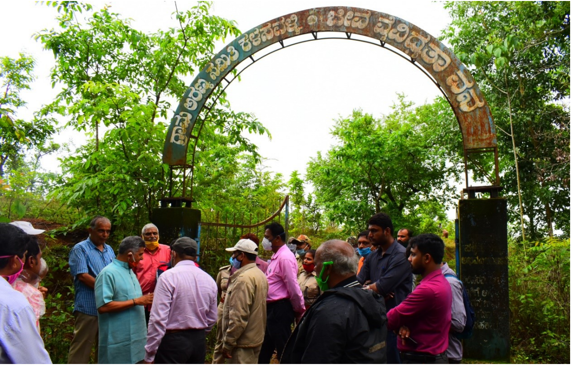
ಜೀವವೈವಿಧ್ಯ ವನದ ಸಂರಕ್ಷಣೆ ಹಾಗೂ ಪುನಶ್ಚೇತನದ ಬಗ್ಗೆ ಸ್ಥಳೀಯರೊಂದಿಗೆ ಚರ್ಚೆ