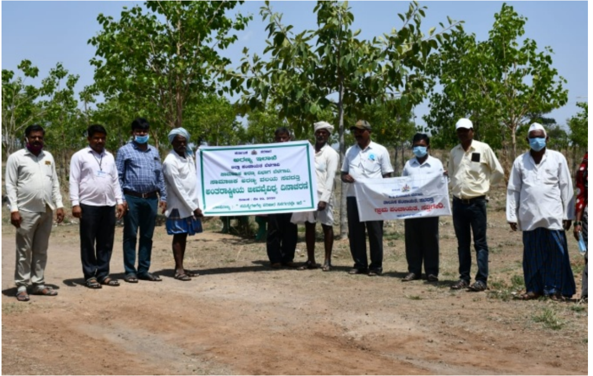
ಸತ್ತಿಗೇರಿ ಗ್ರಾಮ ಪಂಚಾಯತಿ, ಸವದತ್ತಿ ತಾಲ್ಲೂಕು, ಬೆಳಗಾವಿ