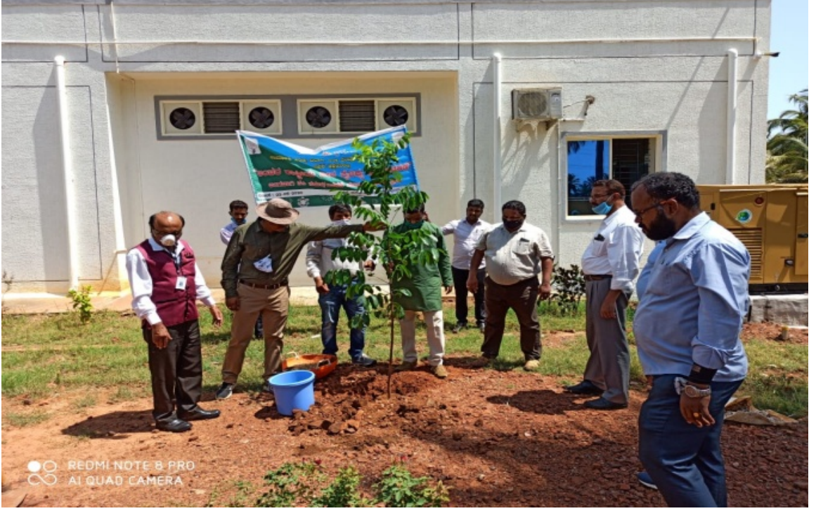
ಪೊನ್ನಂಪೇಟೆ ತಾಲ್ಲೂಕು, ಮಡಿಕೇರಿ