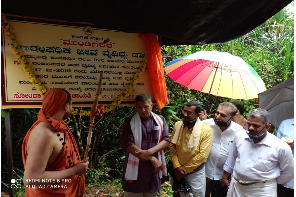
ದಿನಾಂಕ 04.06.2020ರಂದು ಮಾನ್ಯ ಅಧ್ಯಕ್ಷರ ಅಧ್ಯಕ್ಷತೆಯಲ್ಲಿ ಶಿರಸಿಯ ಸೋಂದಾ ಗ್ರಾಮ ಪಂಚಾಯತಿ ವ್ಯಾಪ್ತಿಯಲ್ಲಿನ ಮುಂಡಿಗೆಕರೆಯ ಸಂರಕ್ಷಣೆ ಅಭಿಯಾನ