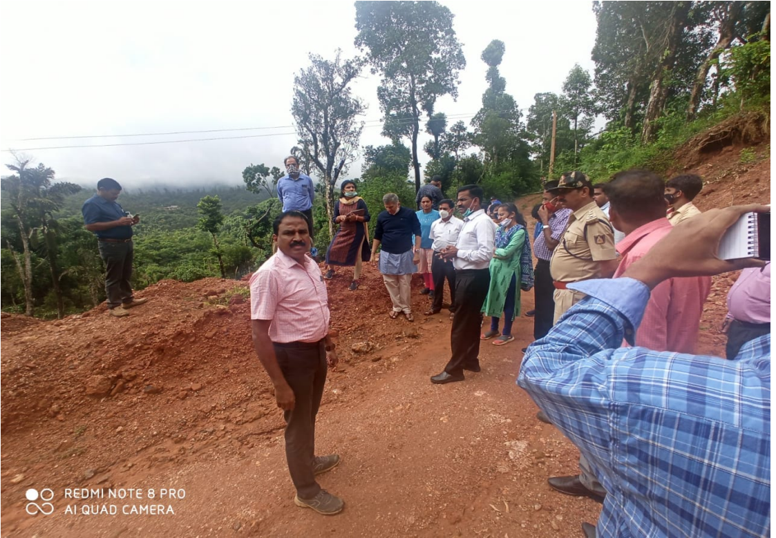
ದಿನಾಂಕ 06.06.2020ರಂದು ಚಿಕ್ಕಮಗಳೂರು ಜಿಲ್ಲೆಯ ಭೂಕುಸಿತ ಪ್ರದೇಶಕ್ಕೆ ಭೇಟಿ ನೀಡಿ ಭೂಗರ್ಭ ಪರಿಣಿತರೊಂದಿಗೆ ಅಧ್ಯಯನ