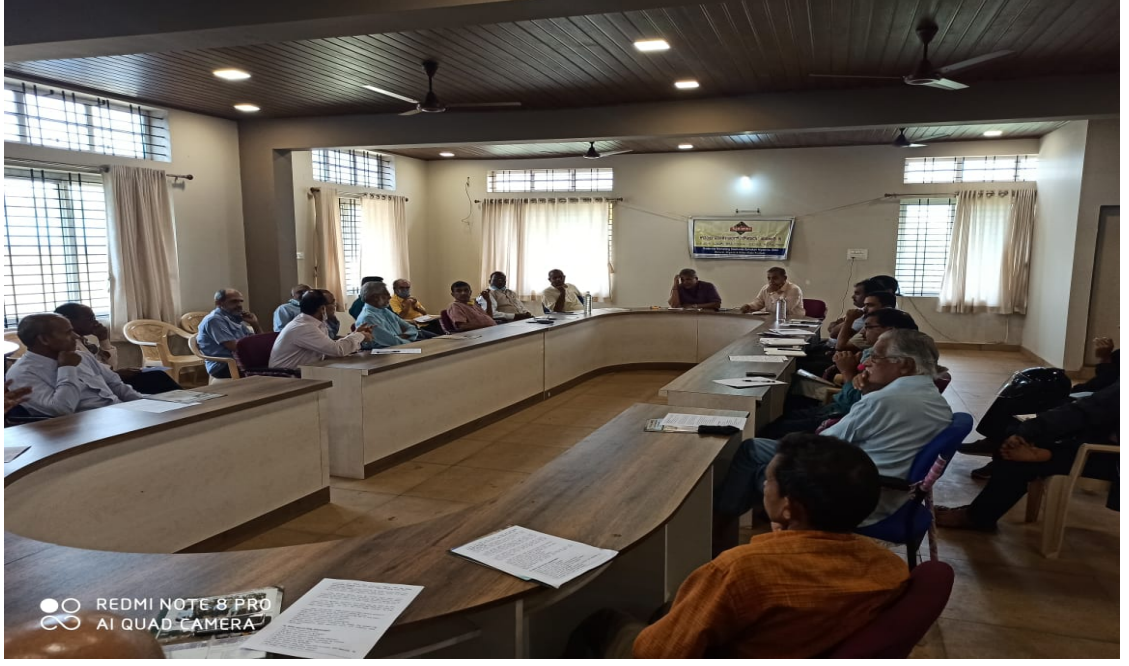
ದಿನಾಂಕ 04.06.2020ರಂದು ಉತ್ತರ ಕನ್ನಡ ಜಿಲ್ಲೆಯ ಶಿರಸಿಯಲ್ಲಿ ಬೆಟ್ಟಗಳ ಸಂರಕ್ಷಣೆಯ ಬಗ್ಗೆ ಮಾನ್ಯ ಅಧ್ಯಕ್ಷರ ಅಧ್ಯಕ್ಷತೆಯಲ್ಲಿ ನಡೆದ ಸಮಾಲೋಚನಾ ಸಭೆ