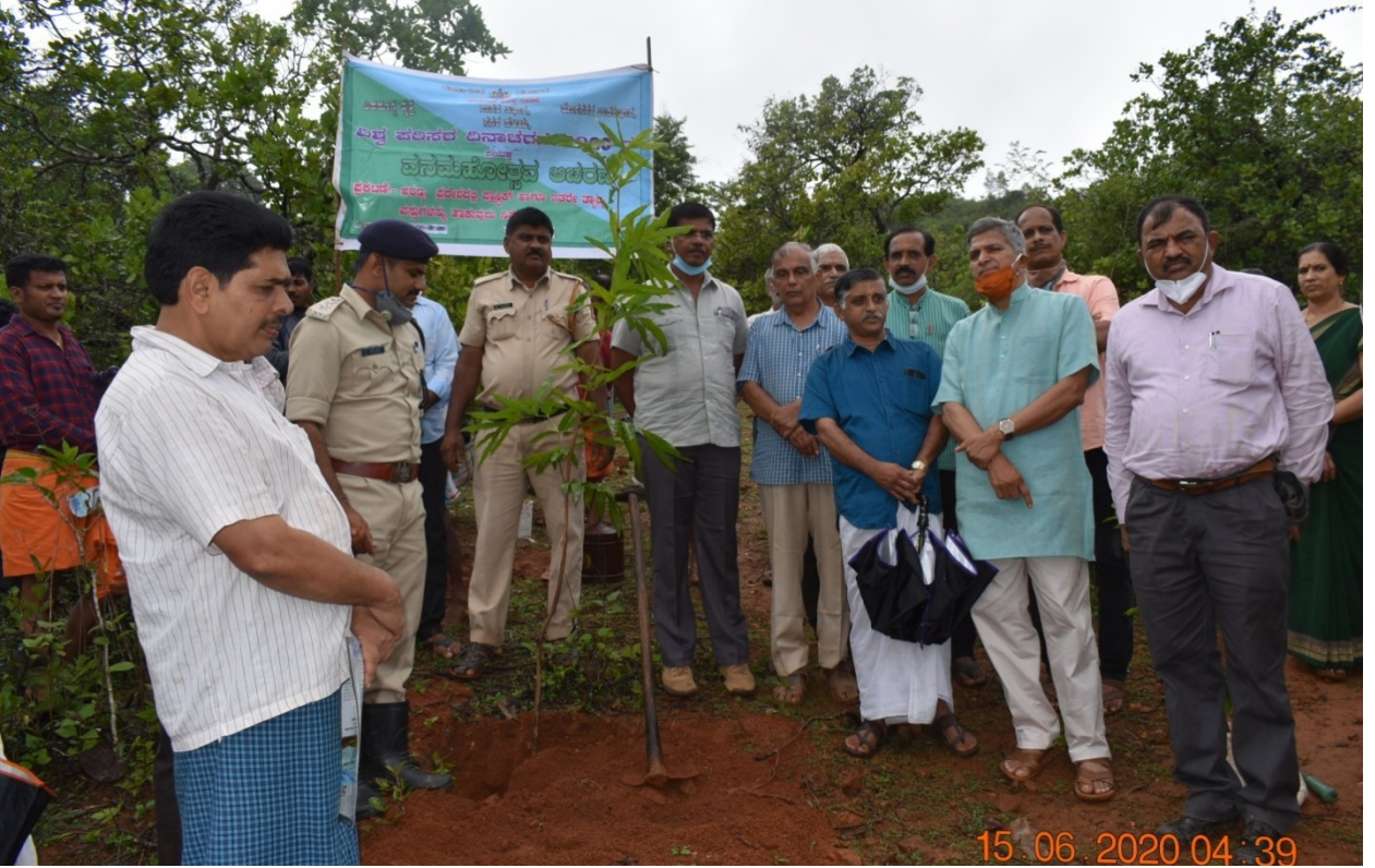
ದಿನಾಂಕ 15.06.2020ರಂದು ಹನಿಯಾ ಗ್ರಾಮದಲ್ಲಿ ವೃಕ್ಷಾರೋಪಣದೊಂದಿಗೆ ಸಂರಕ್ಷಣೆ ಹಾಗೂ ಜಾಗೃತಿ ಅಭಿಯಾನ