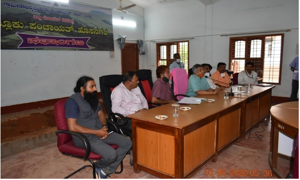
ದಿನಾಂಕ 15.06.2020ರಂದು ಹೊಸನಗರ ತಾಲ್ಲೂಕು ಪಂಚಾಯತಿ, ಜೀವವೈವಿಧ್ಯ ಸಮಿತಿಯೊಂದಿಗೆ ಅಭಿಯಾನದಲ್ಲಿ ಮಾನ್ಯ ಅಧ್ಯಕ್ಷರು, ಅರಣ್ಯ ಅಧಿಕಾರಿಗಳು ಹಾಗೂ ಮಂಡಳಿಯ ಸಿಬ್ಬಂದಿ