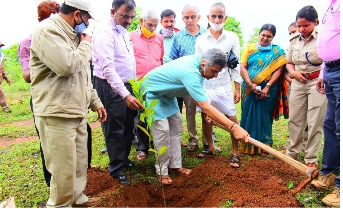
ದಿನಾಂಕ 15.06.2020ರಂದು ತುಮರಿಯ ಕಳಸವಳ್ಳಿಯಲ್ಲಿನ ಜೀವವೈವಿಧ್ಯ ವನದಲ್ಲಿ ವೃಕ್ಷಾರೋಪಣದಿಂದ ಅಭಿಯಾನದ ಚಾಲನೆ