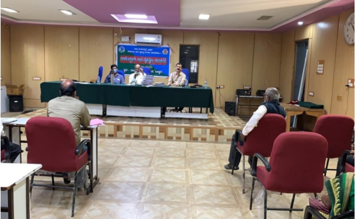
ಬಳ್ಳಾರಿ ತಾಲ್ಲೂಕು ಪಂಚಾಯತಿ, ಬಳ್ಳಾರಿ