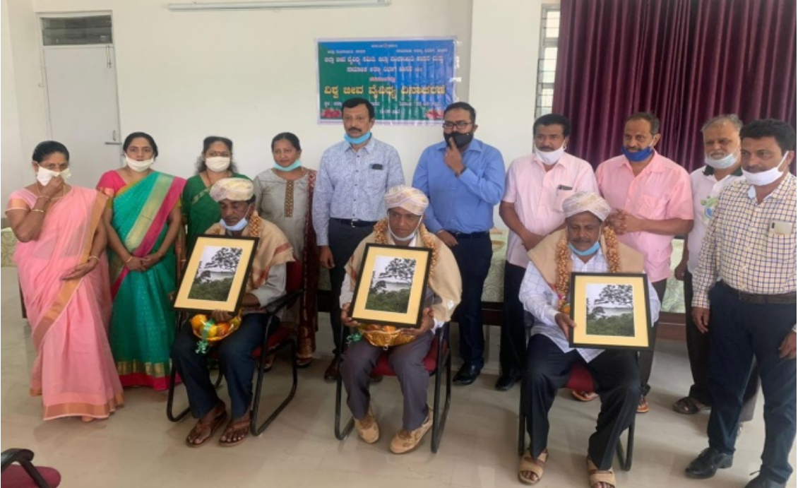
ಜಿಲ್ಲಾ ಪಂಚಾಯತಿ, ಹಾಸನ ಜಿಲ್ಲೆ