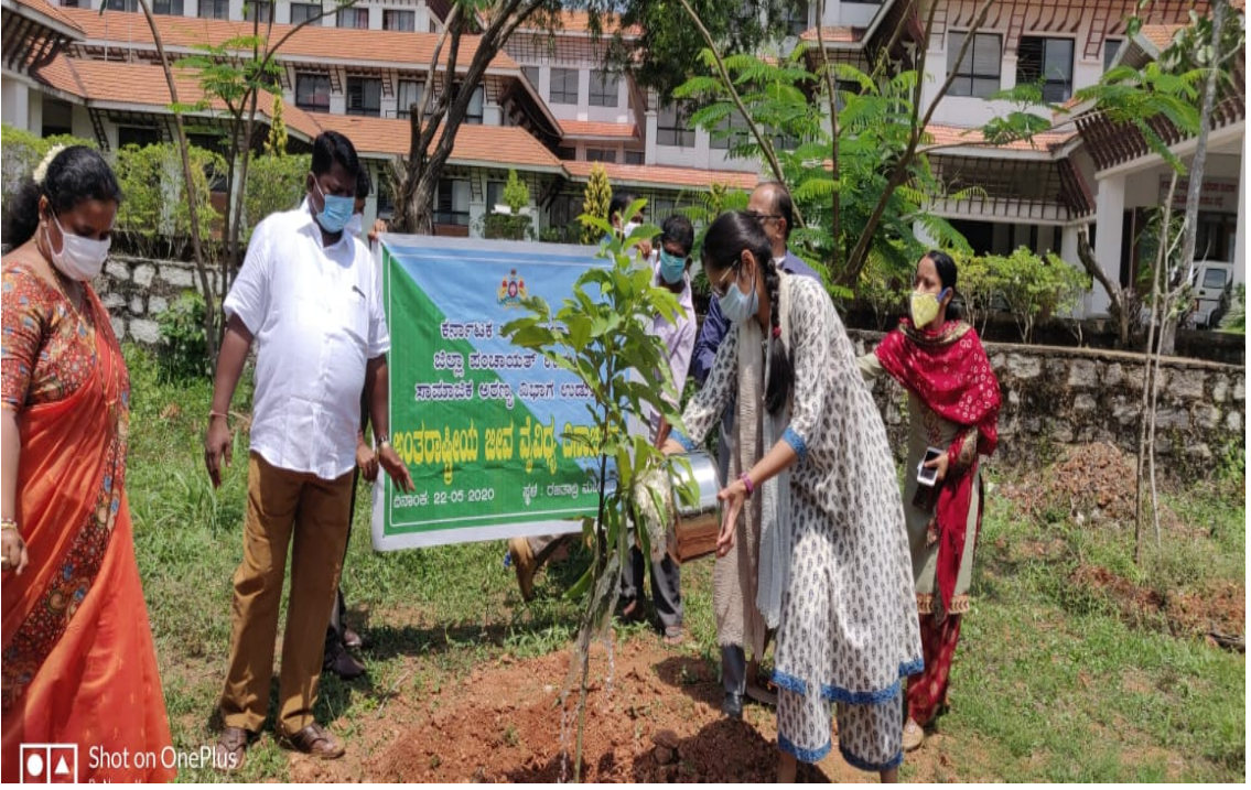
ಉಡುಪಿ ಜಿಲ್ಲೆಯಲ್ಲಿ ವೃಕ್ಷಾರೋಪಣೆ