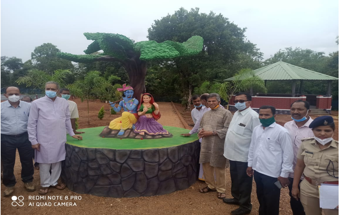
ಮಂಜಗುಣಿ ಗ್ರಾಮ ಅರಣ್ಯ ಸಮಿತಿಯ ವ್ಯಾಪ್ತಿಯ ಪವಿತ್ರವನ ಹಾಗೂ ದೇವರಕಾಡಿನ ಉದ್ಘಾಟನೆ.