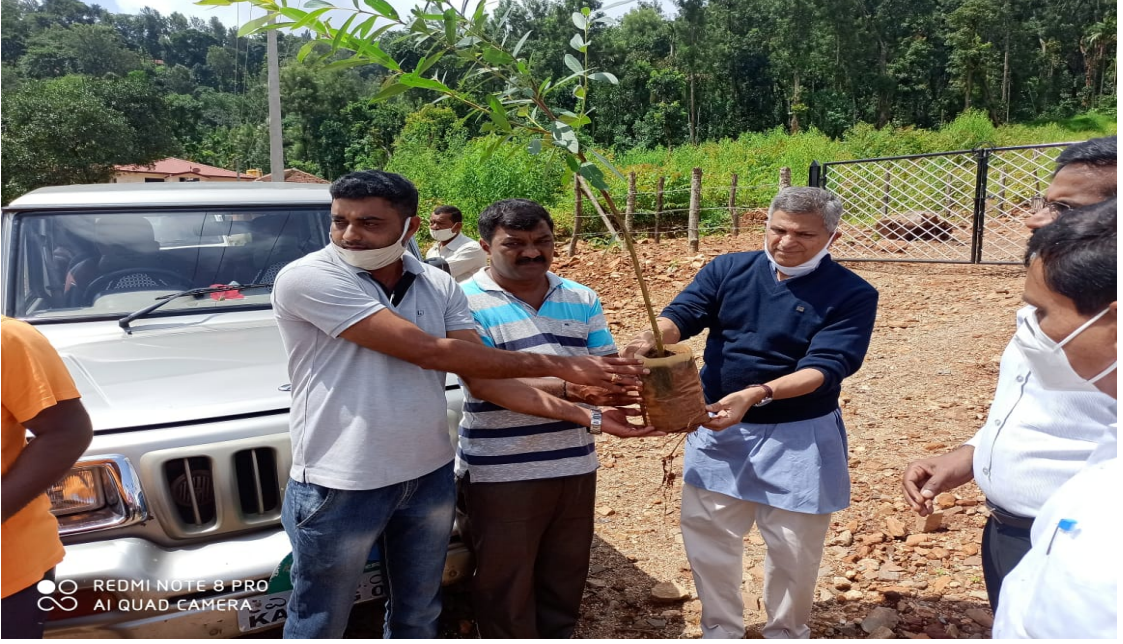
ದಿನಾಂಕ 06.06.2020ರಂದು ಚಿಕ್ಕಮಗಳೂರು ಜಿಲ್ಲೆಯ ಕೊಟ್ಟಿಗೆಹಾರದಲ್ಲಿ ಅಭಿಯಾನ ಹಾಗೂ ರೈತಬಾಂದವರಿಗೆ ಸಸಿಗಳ ವಿತರಣೆ.