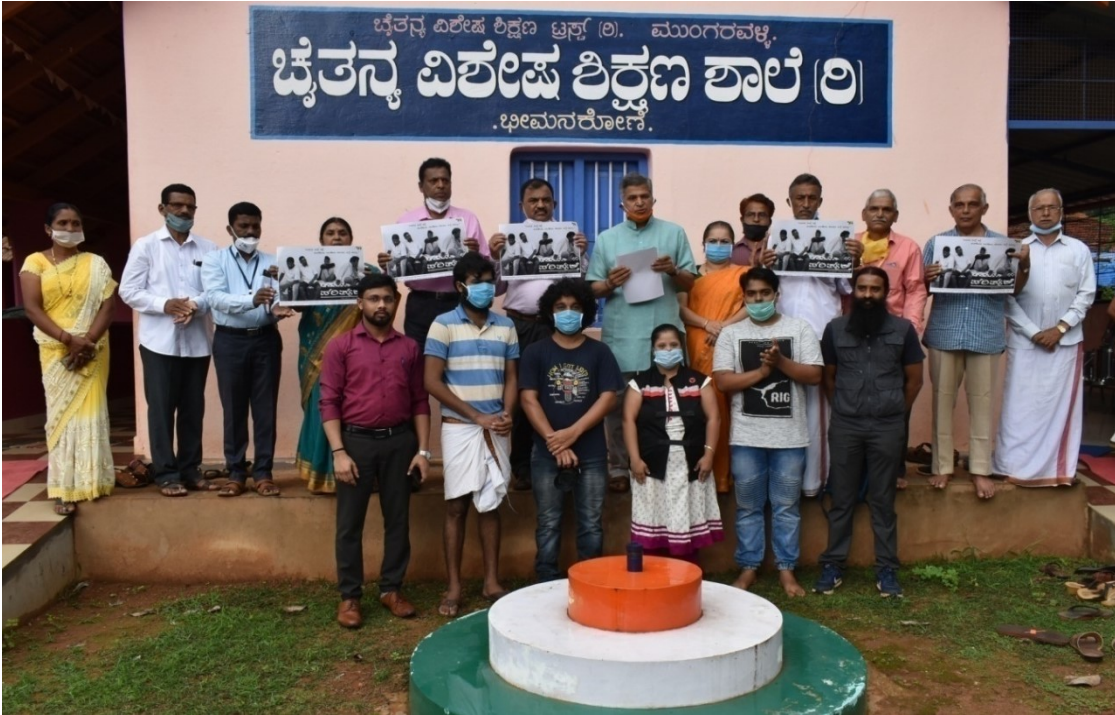
ಅಭಿಯಾನದಲ್ಲಿ ಸಂರಕ್ಷಣೆಯ ಬಗ್ಗೆ ಉದ್ದೇಶಿಸಿ ಜನಜಾಗೃತಿ ಮೂಡಿಸಿದ ಮಾನ್ಯ ಅಧ್ಯಕ್ಷರು