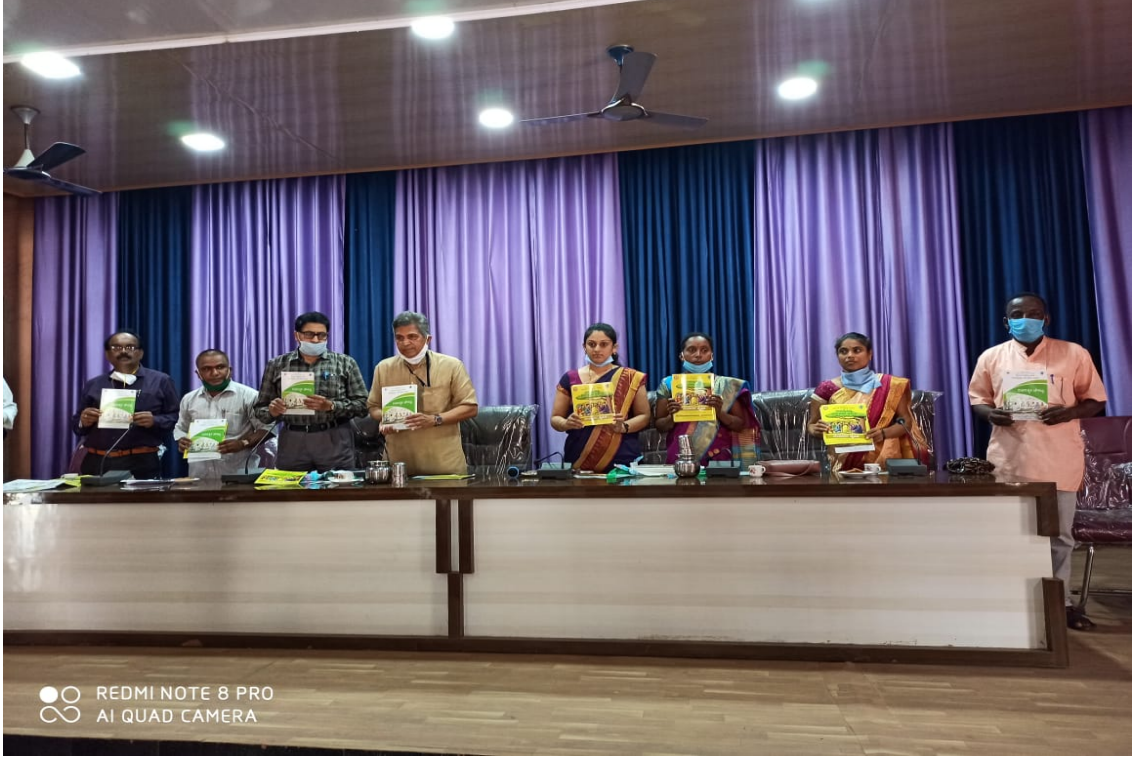
ಉತ್ತರ ಕನ್ನಡ ಜಿಲ್ಲೆಯ ಯಲ್ಲಾಪುರದಲ್ಲಿ ಮಾನ್ಯ ಅಧ್ಯಕ್ಷರ ಅಧ್ಯಕ್ಷತೆಯಲ್ಲಿ ಅಭಿಯಾನ ಹಾಗೂ ಮಂಡಳಿಯ ಪ್ರಕಟಣೆಗಳ ಬಿಡುಗಡೆ